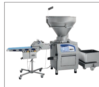
RBF 125 с FB 100 с ленточным прессом.